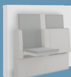
Komfort-Klappsitz Dialog XXL